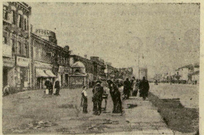
A Mescsanzkaja utca a forradalom előtt...

A szovjethatalom 40 éve alatt valósággal átalakult, megújult a nyolcszáz éves Moszkva. 1917-ben a fővárosban 11 millió négyzetméter lakterület volt. A szovjethatalom 1956-ig 12 millió m 2 új lakóterületet, tehát valósággal egy új Moszkvát épített. A hatodik ötéves terv során a lakásépítés óriási lendületet kapott. A cél: 11 millió 200 ezer négyzetméter lakterület építés, amelyből tavaly 1 347 000 négyzetméter felépült, ebben az évben idáig viszont 1 800 000 négyzetméter. Az új, modern lakások nagyrésze Moszkva új városrészeiben, 6-8 emeletes palotákban van. Két képünk egy utca 40 évvel ezelőtti és mai képét mutatja.