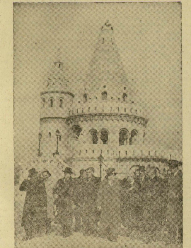
A Szovjetunió Kommunista Pártja veteránjainak hazánkban tartózkodó küldöttsége megtekintette a főváros nevezetességeit is. Képünkön: a kiállított a Halászbástyáról szemlélik a várost.

Ma: Nyolcéves az NDK A Népfront „izgató” kérdései Vendégek Lodzról Szegeden A „vezeklő lányok”-ról Szegedi Szép Szó