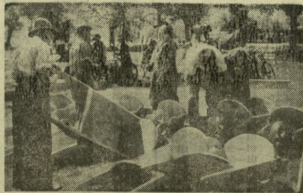
A szegedi és a Szeged környéki falvak, tanyák dolgozó parasztjai azonban megnézték, milyen talicskáért adják a jó pénzt.

— Itt a hírös szögedi vásár, itt vögye mög ustorszáját, bakancesszáját, lószerszámát, talicskáját! Itt a ritka, jó vásári alkalom, ha ugrasztja, szerencséjét szalasztja! — Hallottuk ezeket a portékát uszoló, kínálgató szavakat sokfelé a vasárnapi vásáron. Többnyire a vidéki, a pesti árusok kiabáltak így »szögédiesen«. Alighanem ezzel is kedveskedni akartak a szegedi vevőknek.