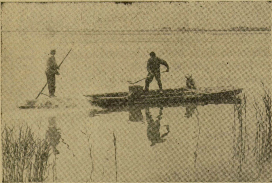
Vízen a Frányó Ferenc újításával ellátott motoroscsónak.