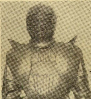
Nem valódi! A Mohácsnál elpusztult Lajos király ifjúkori páncéljának hű mása.

Igy jutunk el az „ömlesztett” fegyvertárho. Először a folyosón, egy ormótan nagyságú szekrényben a régi puskák, karabélyok, pisztolyok és nehéz buzagányok tömkelegét vesszük szemügyre. A régi fegyverek úgy zsúfolódnak itt, mint a gyufák a skatulyában. Majd belépünk a szobába, ahol egy állvány válogatott formájú és korú kard hever, ha éppen a rozda nem is marja — nem ragyog. Köztük régi számszeríjakkal láthatók. (Egy ilyenlőhetőtték le Tell Vilmos fia fejéből azt a híres almát!) Oldalt az ajtó mellett pedig Szeged régésregi, közel két méteres, hatalmas súlyú fejvevő pallosa mered elénk. Mögötte a sarokban sorakoznak az óriási alabárdok, az egykori strázsák és a hajdani, éjszakát kiáltó bakterek ormótan fegyverei. De mindezeknél inkább vonzza a kíváncsiságot az a páncél, amely mint egy gyereknagyságú emberalak áll elénk. Pedig ez nem is eredeti, közönséges bádóg, csak meg kell kopogtatni. Bezzeg nem merte senki megkopogtatni eredetjét, amidőn gazdája hordta. Mert ez az életét Mohácsnál tragikusan elvesztő Lajos király gyermekkori páncéljának utanzata. A szoba sarkából pedig egy sereg ijesztő fej néz felénk, ezek azonban nem a fegyvertár, ha-