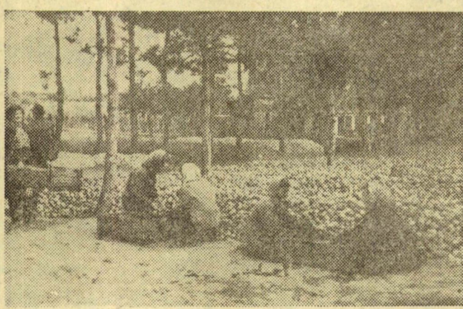
A leszedett almát a célgazdaságokban ládába rakják. A szegedi járás gyümölcse nemcsak Szegedre és belföldre, hanem külföldre is elkerül

— Meselelelőttöt rendez ma délelőtt 10 órakor a Juhász Gyula Művelődési Otthon. Előadásra kerül »A búvós furulya« című mese, majd utána levetítik a »Münchhausen báró kalandjai« című diafilmet.