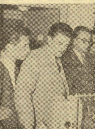
Látogatás a Szegedi Orvostudományi Egyetem Gyógyszertani Intézetében.