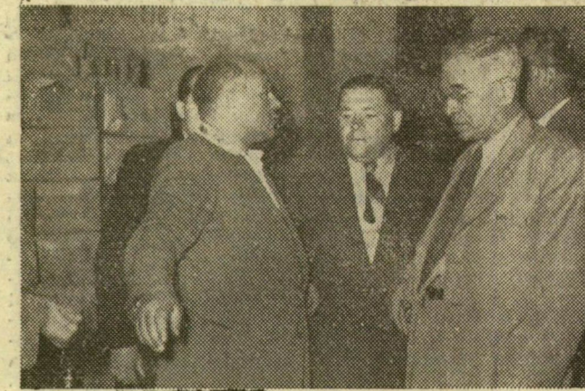
Több kereskedelmi vállalatot látogattak meg a küldöttek, ahol több hasznos észrevételt tettek.