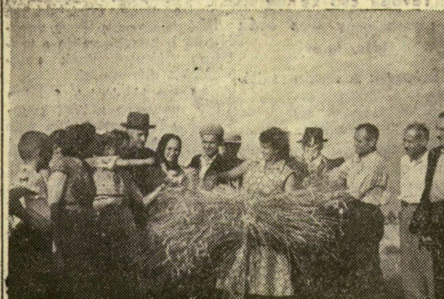
Nem kevésbé érdekelte a látogatókat a növénytermesztés munkája. — Hogy fizet a gabona? — tették fel a kérdést férfiak és nők, miközben megemelték a zsúfolt kékvetet és megmorzsolgatták a dús kalászkodat