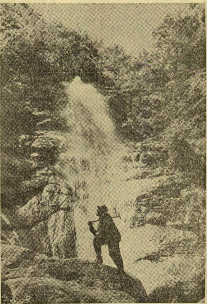
A szovjet turisták nyári szabadidejükben szívesen látogatnak el Grúzia mesés szépségű tájaira. Képünkön: a namahvani vízesés a Rioni folyón

A kékfestőn kívül a kötöttáru részleg is új választékkal bővíti áruit. Újfajta női hosszújjú és japánújjú pulóvereket készítenek fésűs gyapjából. Ezek a pulóverek enciánkék színben és háromféle méretben kerülnek forgalomba.