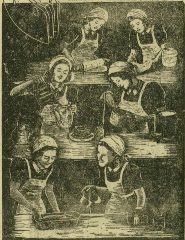
1937-ben ünnepelte az ország a 25. évfordulóját a putnoki m. kir. gazdasági felső leánynevelő-intézet fennállásának 25. esztendő jubileumát. Azóta napra mindinkább növekedik a nagyszabású intézet tekintélye. Ez nem is olyan csodálatos, ha megfontoljuk, hogy ennek az intézetnek egyik növendéke a budapesti országos háziasszonyverseny alkalmával az első, egy másik növendéke pedig az 1937. évi párisi nemzetközi háziasszonyversenyen a dícséretre méltó második díjat nyerte el.