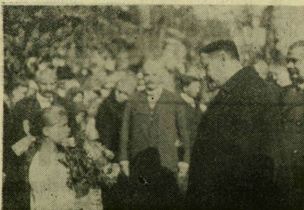
Alsótanyán. Egy tanyai kislány virágot nyújt át a miniszternek.