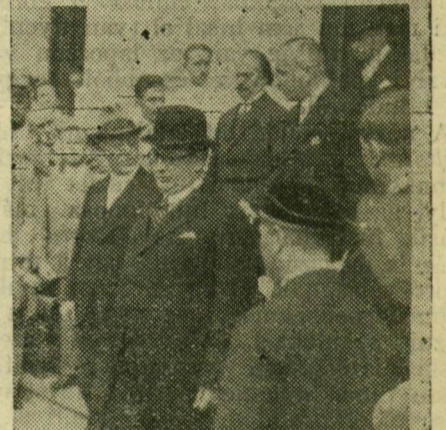
A felső kép: Becker porosz kultuszminisztert doktorrá avatja a szegedi egyetem. A miniszter Becker és Somogyi polgármester között ül. — Alsó kép: Beckerrel távozik az egyetem ünnepi közgyűléséről.