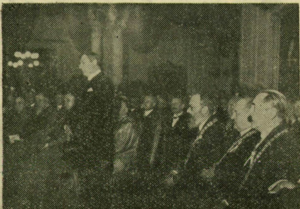
A diszközgyűlésen megköszöni a diszpolgárságot és válaszol az üdvözlő beszédekre. Mögötte az egyetemi tanács és a püspöki kar tagjai ülnek.