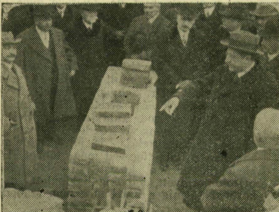
Elhelyezi az ipartestület új székházának alapkövét.