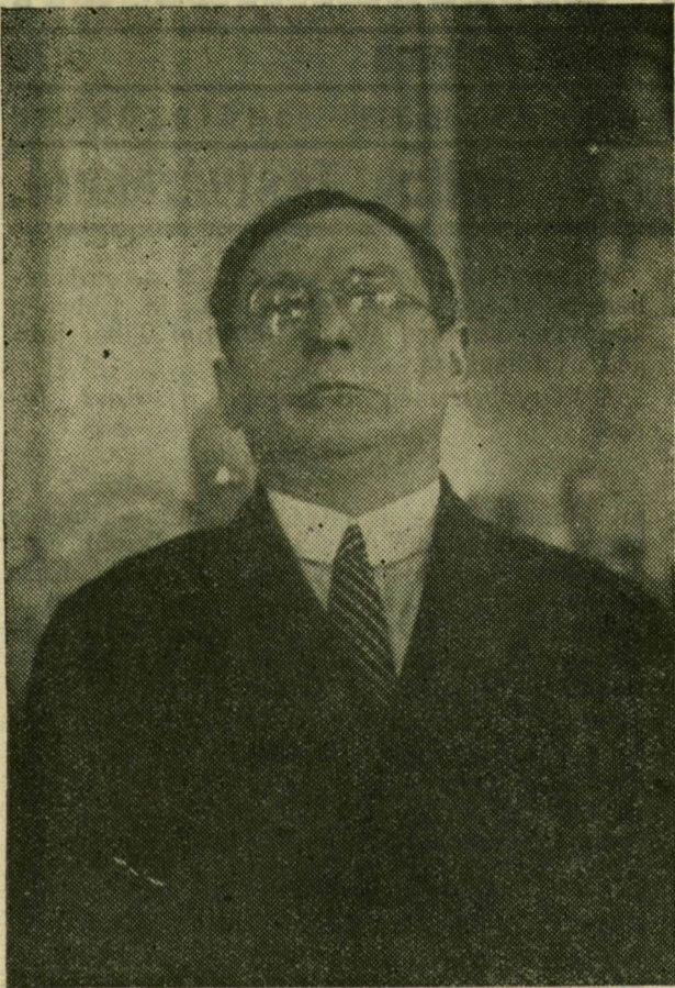
Szeged közgyűlése diszpolgárrá választotta. Nagy figyelemmel hallgatja a közgyűlési teremben a polgármester beszédét.

Ezek a képek cselekvő életének néhány pillanatát örökítik meg, Szeged és az egyetemes magyar kultúra számára felejthetetlen pillanatok. Izgalmasan szép riportot lehetne írni valamenyiről.