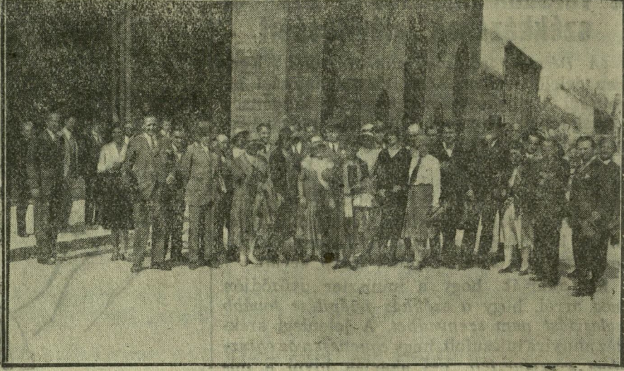
A vendégek a Templom-téren.