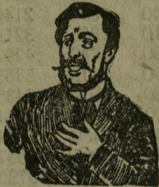
Megfojt ez az átkozott köhögés!