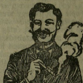
EGGER mellpasztillái csakhamar meggyógyított!