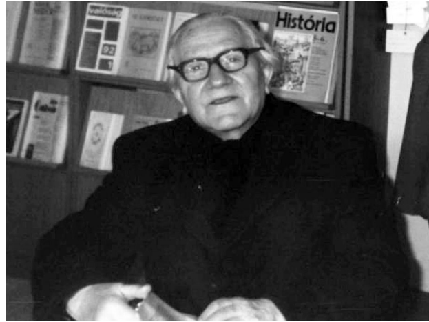
5. KÉP Nikefor atya gazdag életét meséli az Egri Főegyházmegyei Könyvtárban 1992-ben

véltári kutatásait. 6 A fiatalabb történelmszociológiai generációból kiemeljük: a huszonegyedik század első évtizedében több szintézis jellegű monográfiát